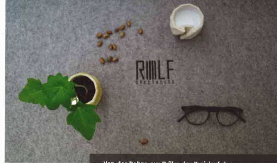
Von der Bohne zur Brille: der Kreislauf der Substance-Kollektion.

MIT GOLD AUSGEZEICHNET. Für die Produktion im 3D-Druckverfahren wird aus den Bohnen des Wunderbaums feinstes Mehl schichtweise aufgetragen und gehärtet. Das neue „Flexlock“-Gelenk ist patentiert und wird ebenfalls im 3D-Prozess mitgedruckt. Das Gummigelenk ersetzt Schrauben und Federn, fungiert als Stoßdämpfer. Es macht die Brille ultraflexibel und unzerstörbar. Veredelt werden die „Substance“-Brillen in einer großen Trommel mit Schleifpartikeln (Bild 2). Mit der „Substance“-Kollektion, die in vielen Modellen, Farben und auch als Sonnenbrille in Sehstärke erhältlich ist, hat ROLF ein leistbares, nachhaltiges Produkt im mittleren Preissegment auf den Markt gebracht.